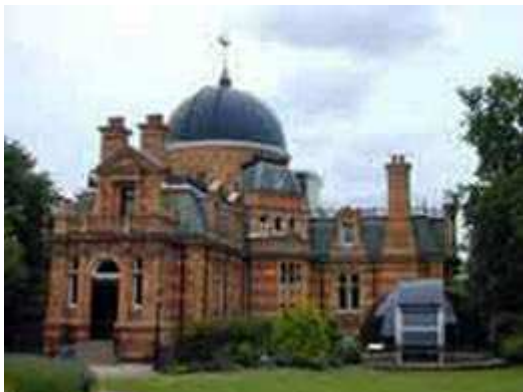
“Greenwich Royal Observatory”

¿Y qué de la última shabua , es decir, la semana de años que todavía falta para completar las Setenta?