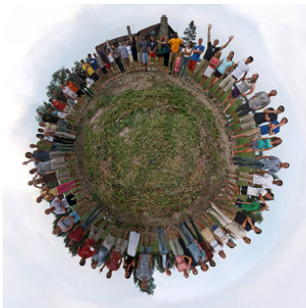
“El campo es el mundo”

Así que el Sembrador – que es Cristo – siembra el mundo de hijos del Reino – es decir, de verdaderos cristianos – componiendo de esta manera Su tragal. Esto nos enseña que ese tragal, es decir la verdadera Iglesia, reside en el campo, que es el mundo: “El campo es el mundo...” (Mt. 13: 38)